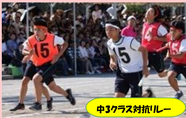
中3クラス対抗リレー