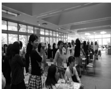
↑ グーチョキパーでクイズに答える