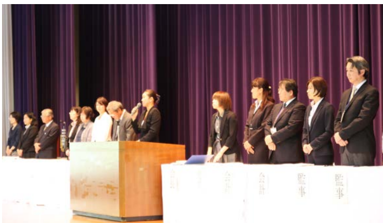
承認を受ける平成27年度支援会役員